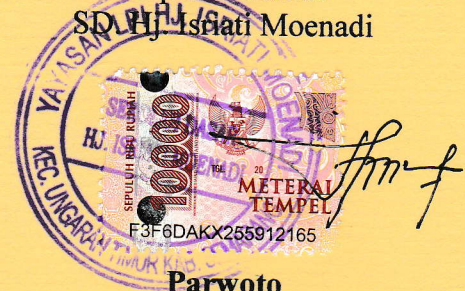
Parwoto NIP. -